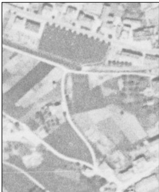
Orthophoto Swisstopo 1946

Si nous ne connaissons pas exactement l'année de construction de la rue des Vannes, un examen des photos aériennes de Swisstopo nous permet de l'estimer au début des années 1950. Pour celle du Boqueran, environ 1958.