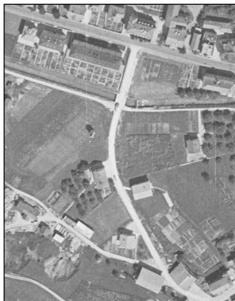
Orthophoto Swisstopo 1951

Au vu de l'état du revêtement, on peut en conclure que très peu de rénovations y ont été menées et les seuls « tacons » visibles sont dus aux fuites d'eau ou à des nids-de-poule.